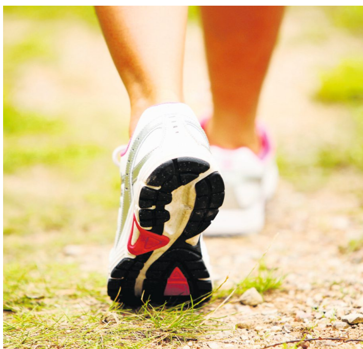
Sport ist einer der drei Bereiche, für den sich die Kommissionsmitglieder aus der Gemeinde Kirchberg starkmachen.

Grundlage für die Tätigkeit der Kommission KFS war ein Beschluss des Gemeinderates vom 30. November 2010. Mit der ersten Sitzung vom 7. Februar 2011 nahm die Kommission ihre Ar-